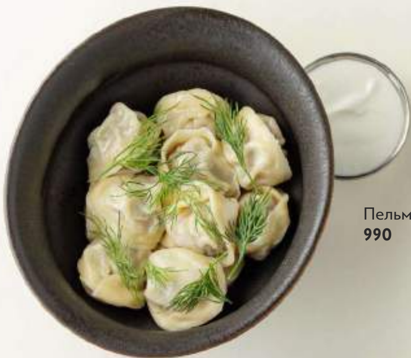
Пельмени сибирские 990