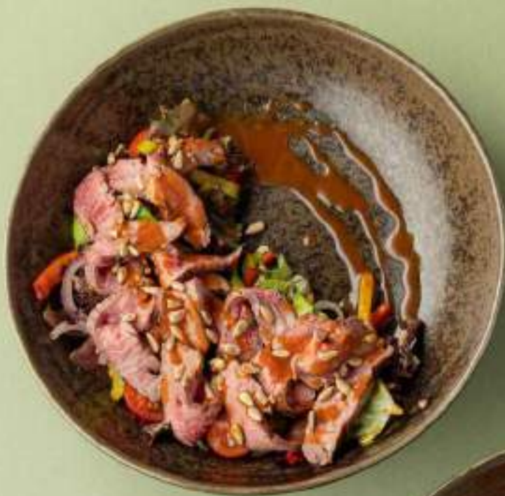
Стейк-салат с говядиной и соусом шисо-барбекю 1290