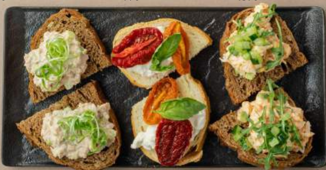
Брускетта с острым крабом, авокадо и огурцом 1590

Если у вас есть аллергия на какие-либо ингредиенты, пожалуйста, сообщите об этом своему официанту.