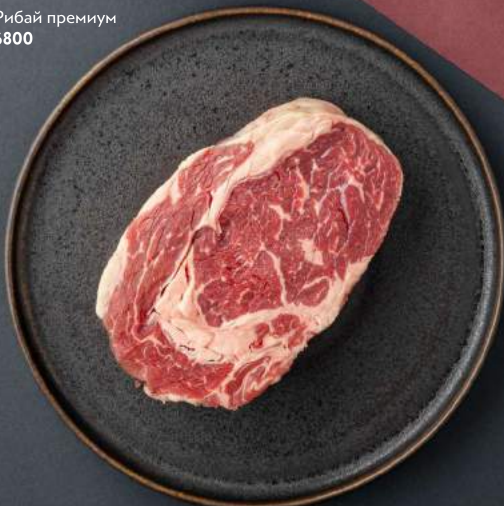
Рибай премиум 6800

Если у вас есть аллергия на какие-либо ингредиенты, пожалуйста, сообщите об этом своему официанту.