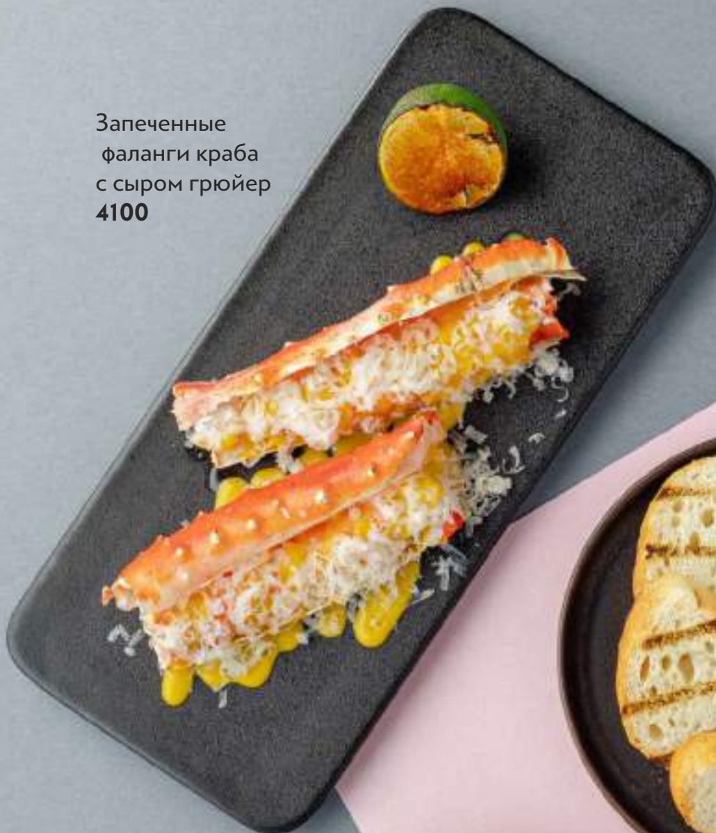
Запеченные фаланги краба с сыром грюйер 4100