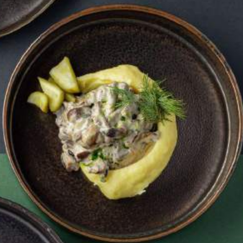
Бефстроганов из мраморной говядины 1290