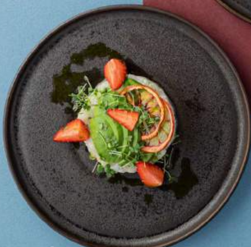
Тартар из креветок с авокадо и клубникой 1490