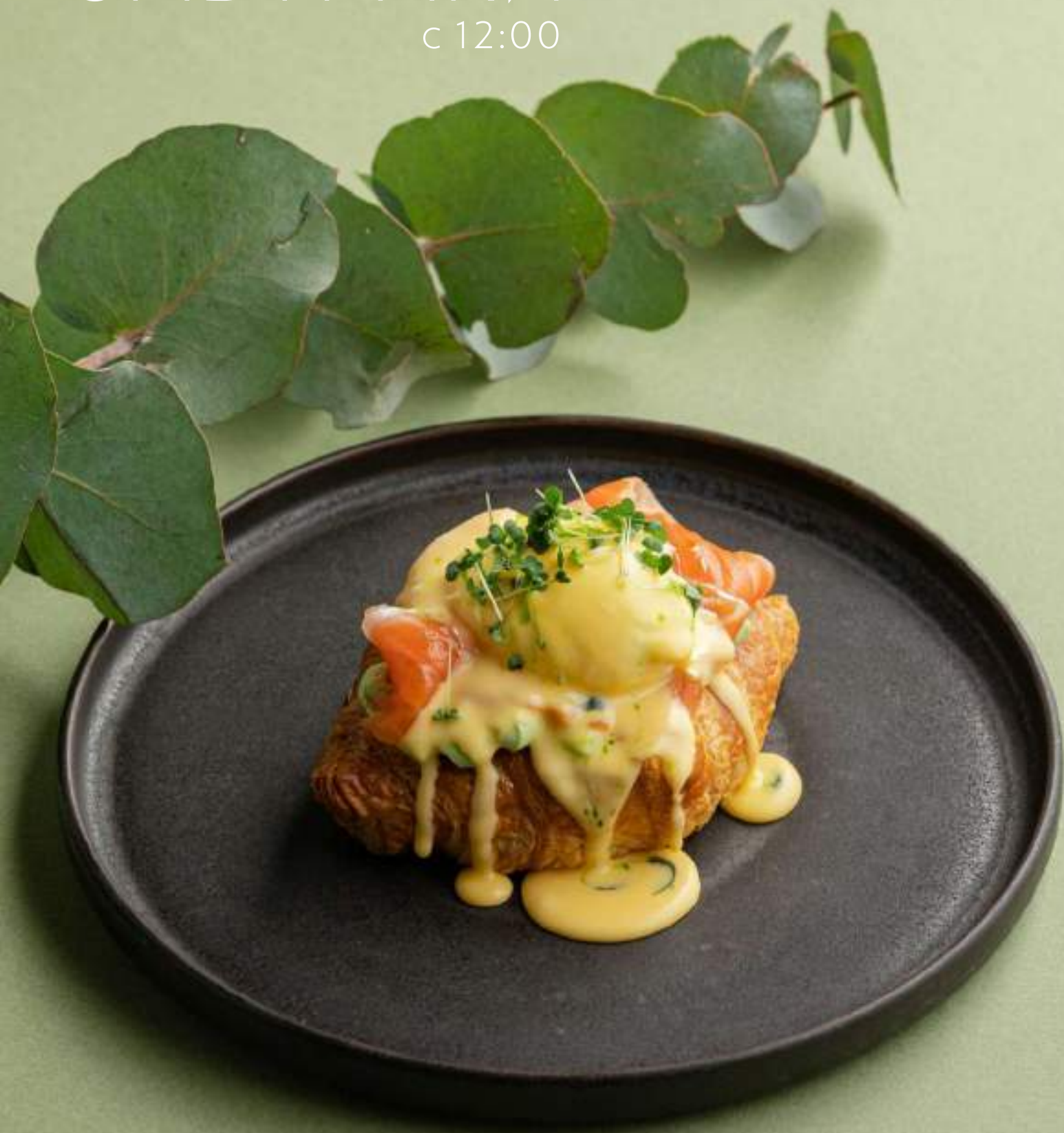
Круассан с форелью, авокадо и яйцом пашот 1190

Если у вас есть аллергия на какие-либо ингредиенты, пожалуйста, сообщите об этом своему официанту.