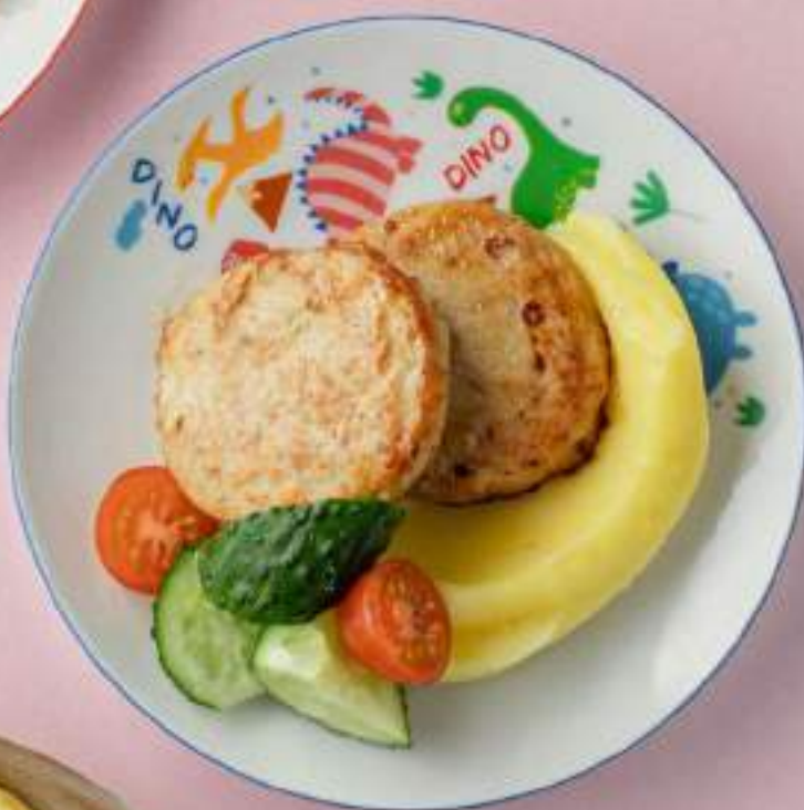
Куриные котлетки с пюре 720