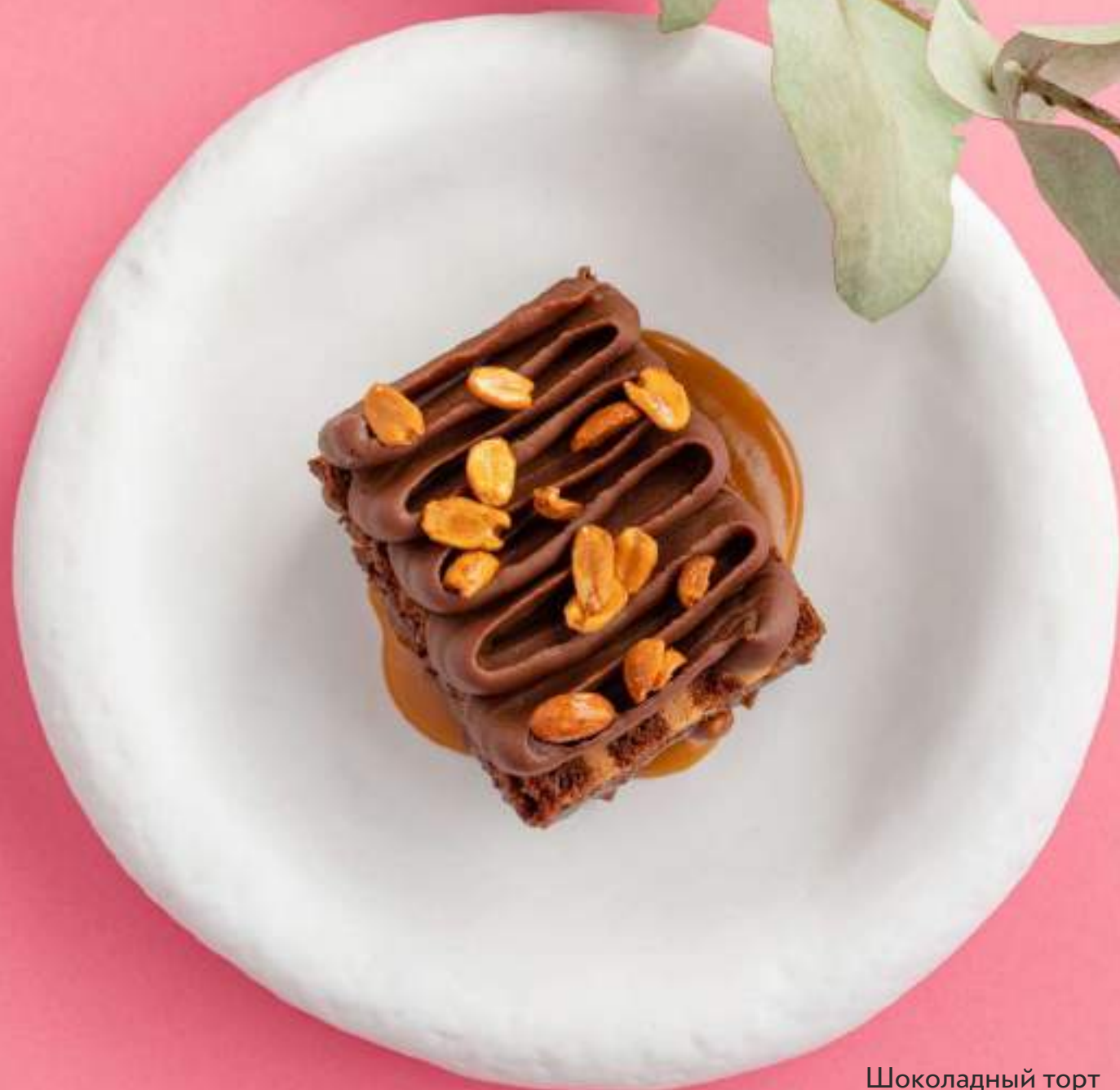
Шоколадный торт с соленой карамелью и арахисом 690

Если у вас есть аллергия на какие-либо ингредиенты, пожалуйста, сообщите об этом своему официанту.