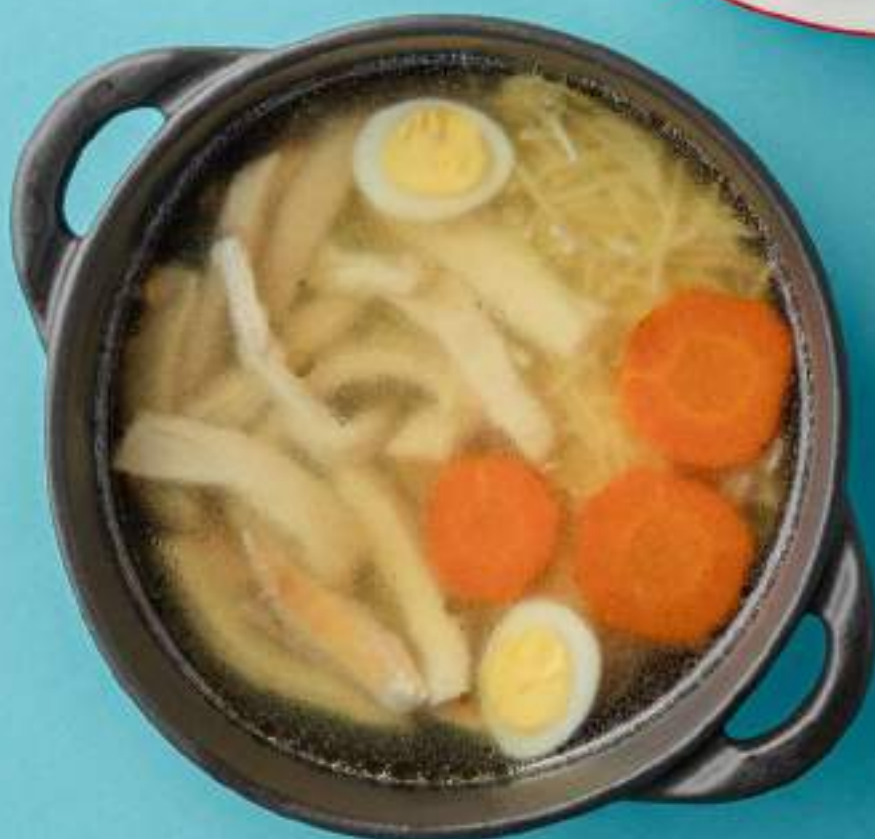
Детский супчик с индейкой 510