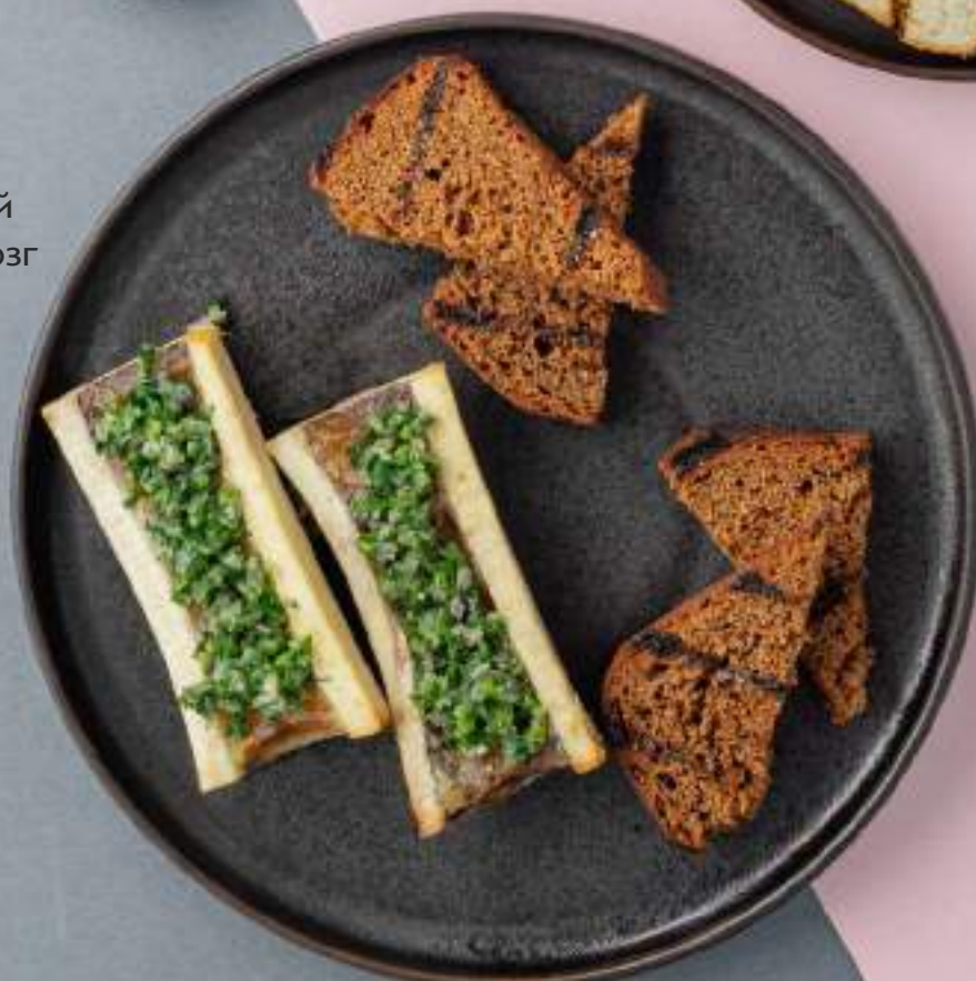
Запеченный костный мозг 720