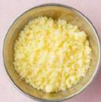
Макароны с сосисками / с сыром 560 / 530