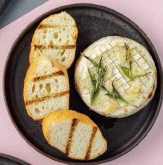
Запеченный бри 890