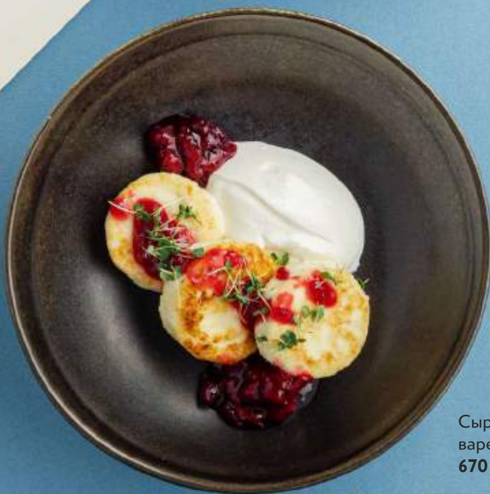
Сырники с вишневым вареньем и сметаной 670