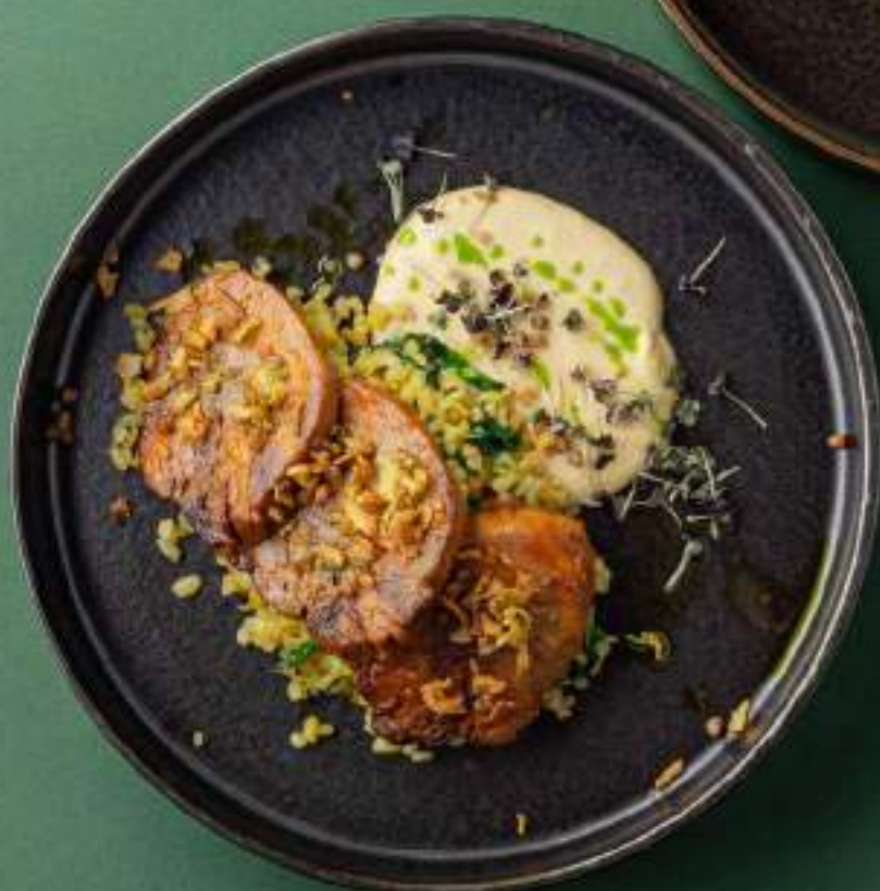
Говяжий язык с булгуром и трюфельным соусом 1190