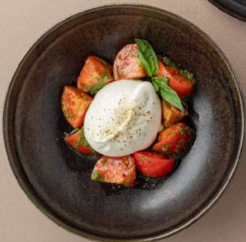
Буррата с томатами и песто 1790