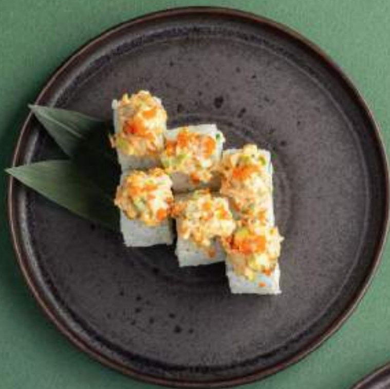
Ролл с креветкой темпура, крабом и угрем 1890