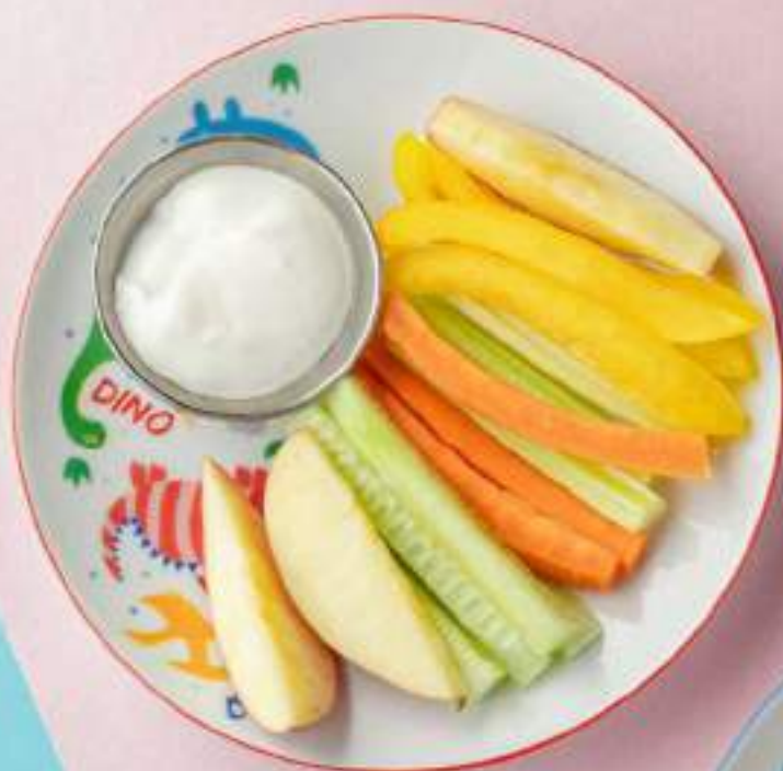
Овощные палочки 490