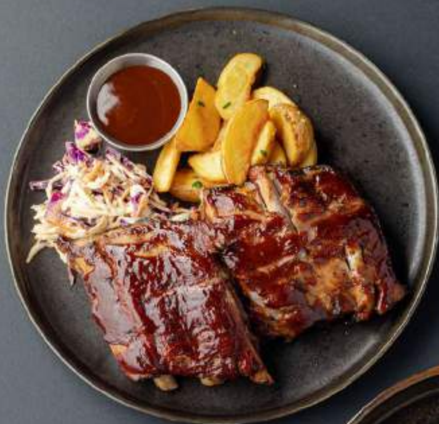
Свинные ребра BBQ с картофелем 1650