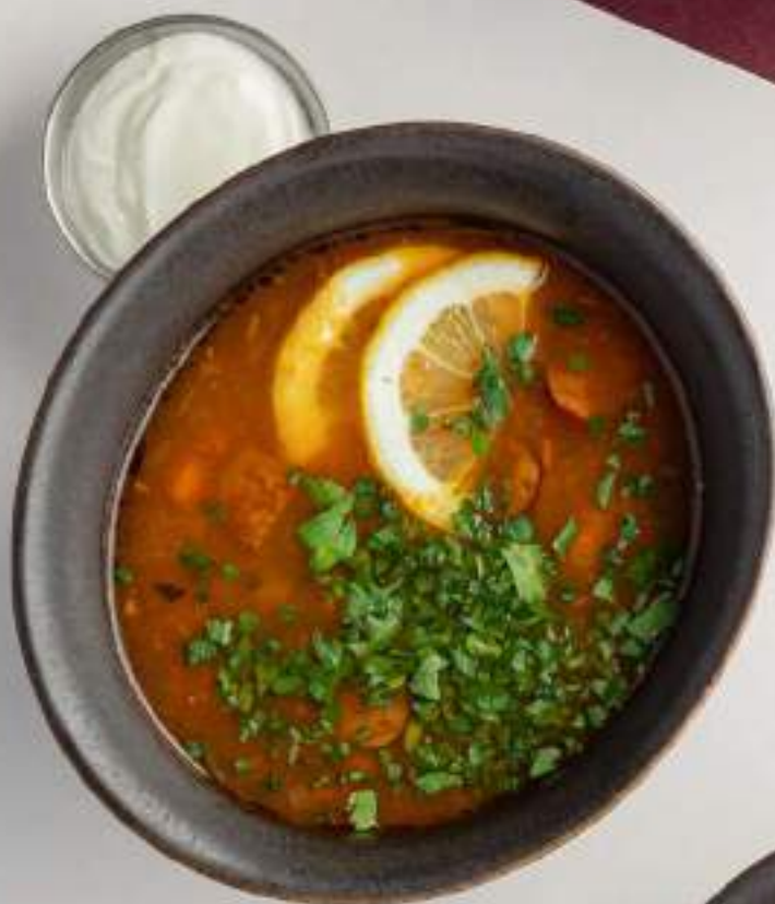
Щи с квашеной капустой и белыми грибами 750