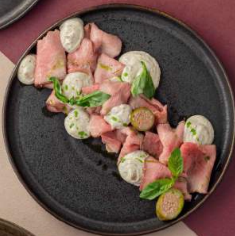
Вителло тоннато с трюфелем 1390