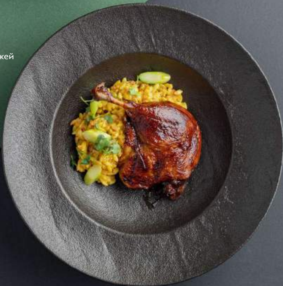
Утка конфи с орзо и спаржей 1490