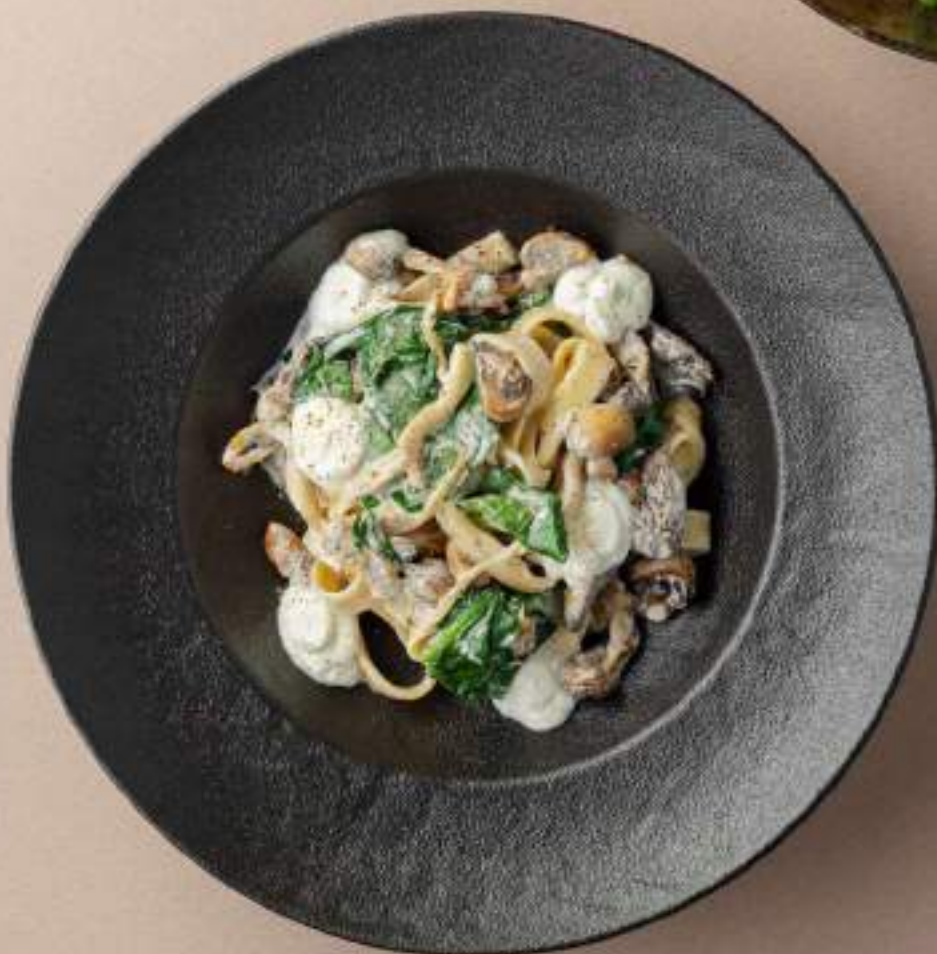
Тальятелле с грибами, шпинатом и сыром Шевр 990