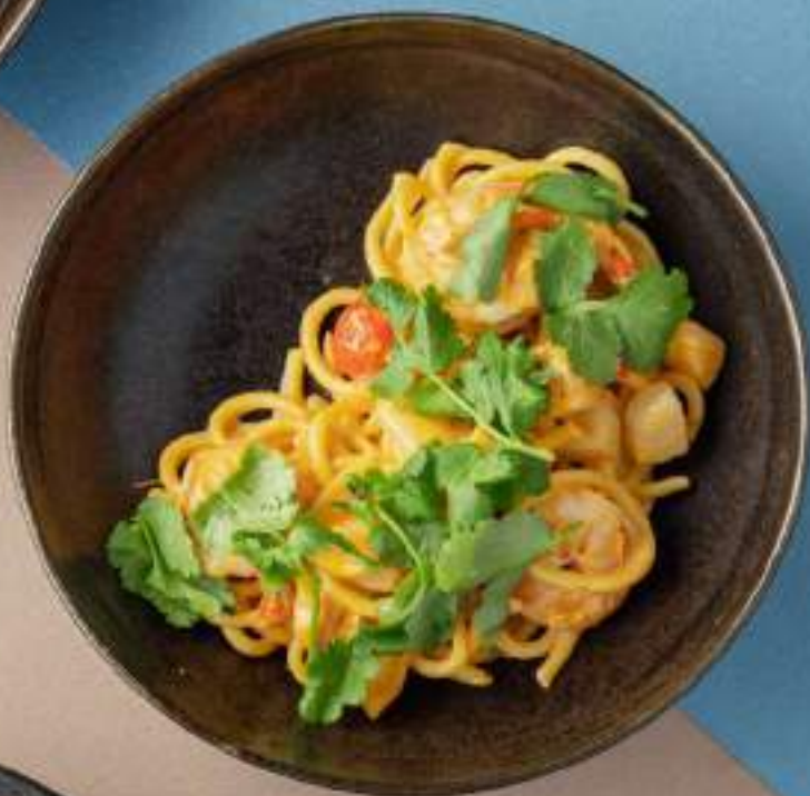
Спагетти с креветкой, гребешком и соусом том ям 2190