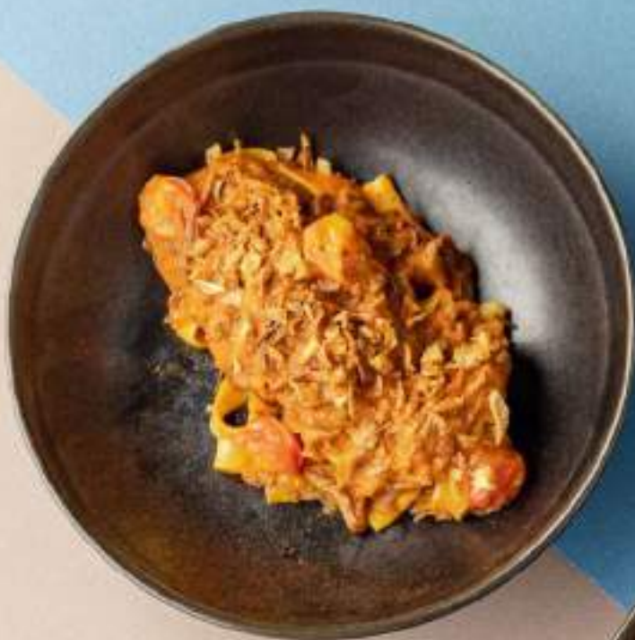
Фетучини с рваной говядиной и соусом из копченых томатов 1590