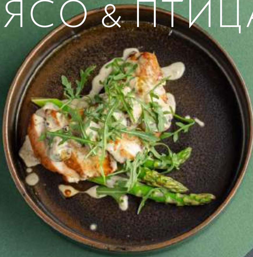
Куриная грудка со спаржей и белыми грибами 1690