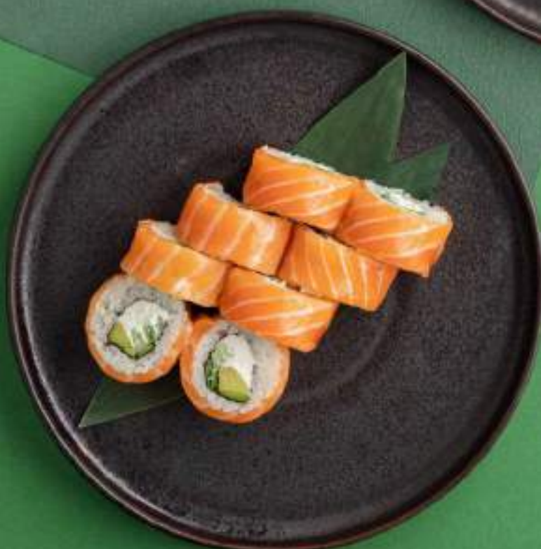
Филадельфия с лососем/угрем 1720/1620