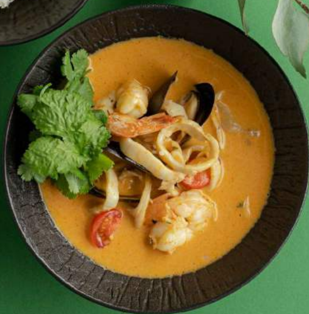
Том ям 1340

Если у вас есть аллергия на какие-либо ингредиенты, пожалуйста, сообщите об этом своему официанту.