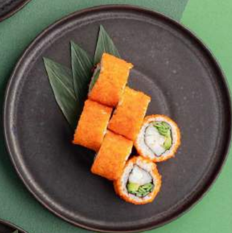
Калифорния с крабом/креветкой 1690/1520