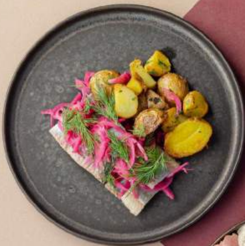
Сельдь с картофелем и маринованным луком 690