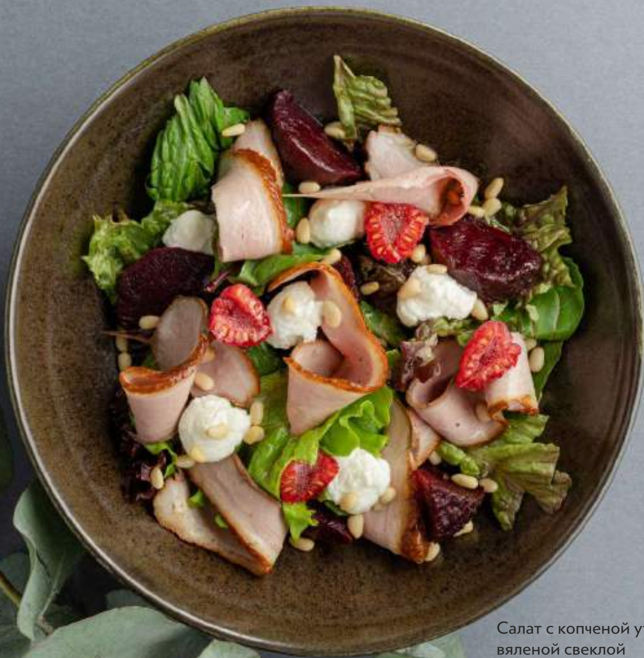
Салат с копченой уткой, вяленой свеклой и козьим сыром 1350

Если у вас есть аллергия на какие-либо ингредиенты, пожалуйста, сообщите об этом своему официанту.