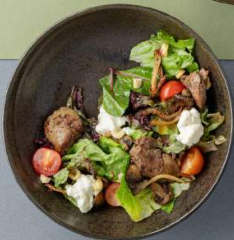
Теплый салат с куриной печенью, страчателлой и грибами 990