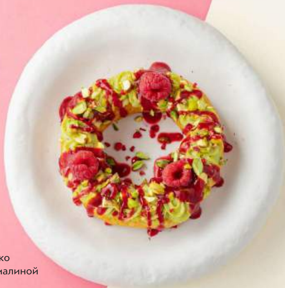
Заварное колечко с фисташкой и малиной 990