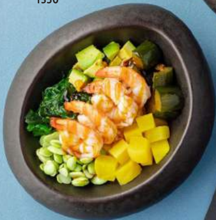
Поке с креветкой 1350