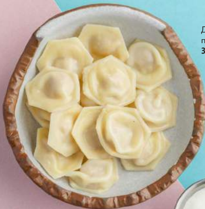
Детские пельмешки 360