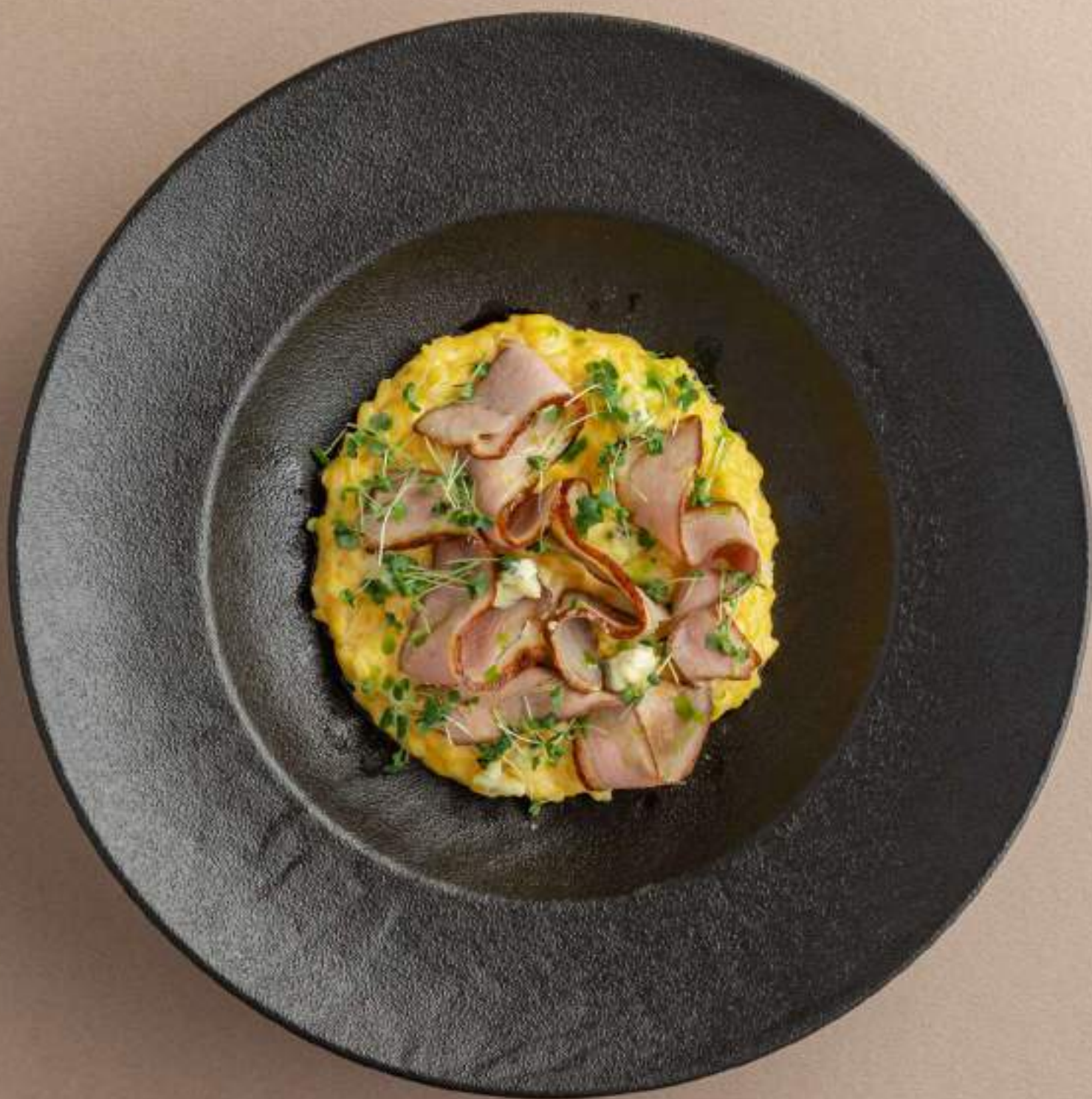
Тыквенное ризотто с копченой уткой 1590