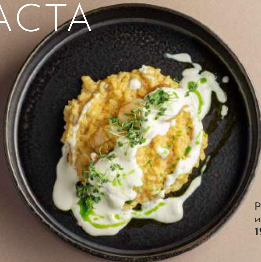
Ризотто с гребешком и соусом «Карбонара» 1950