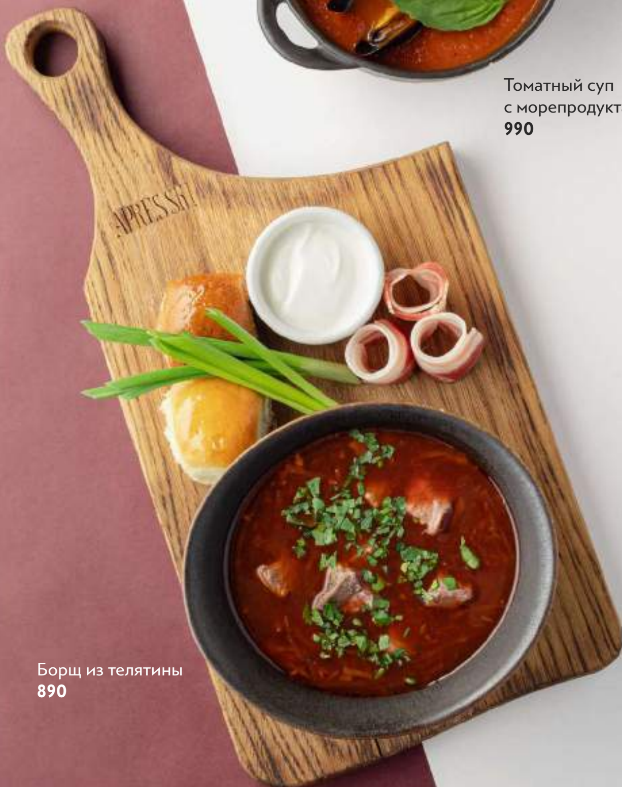
Борщ из телятины 890