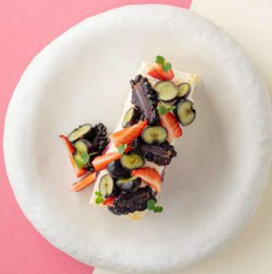
Меренговый рулет с черной смородиной 990