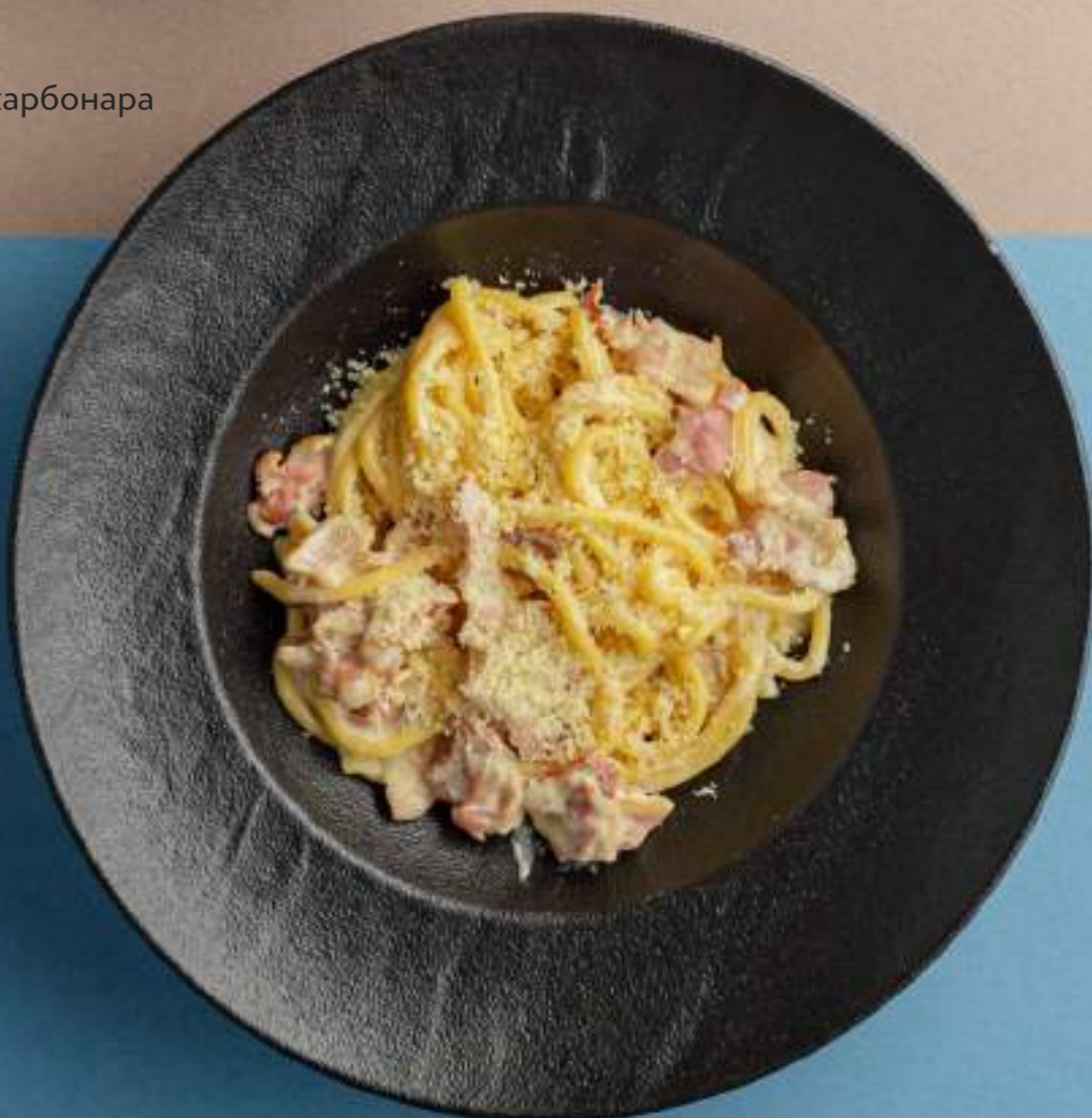
Спагетти карбонара 960

Если у вас есть аллергия на какие-либо ингредиенты, пожалуйста, сообщите об этом своему официанту.