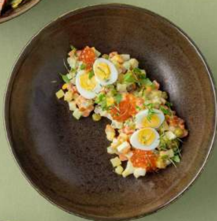
Оливье с копченой форелью 730