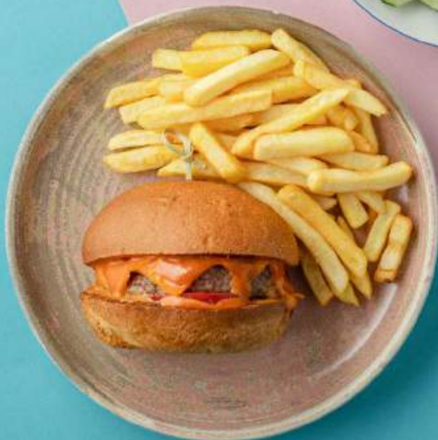
Детский чизбургер с картофелем фри 730