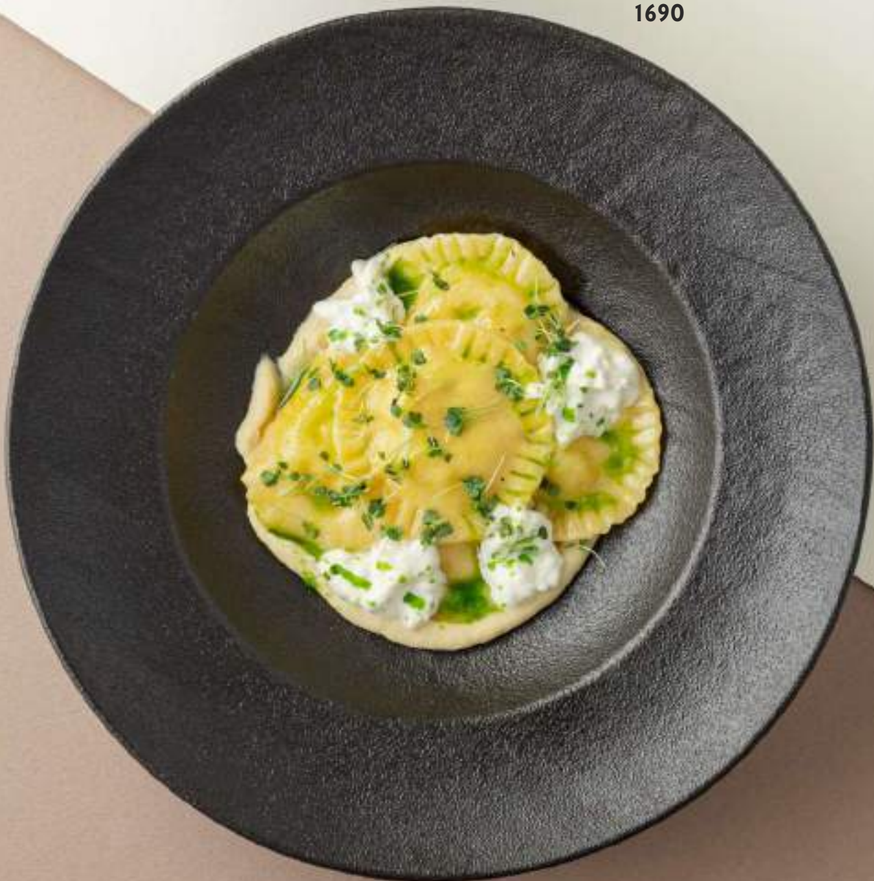
Рабиоли с крабом и страчателлой 1690