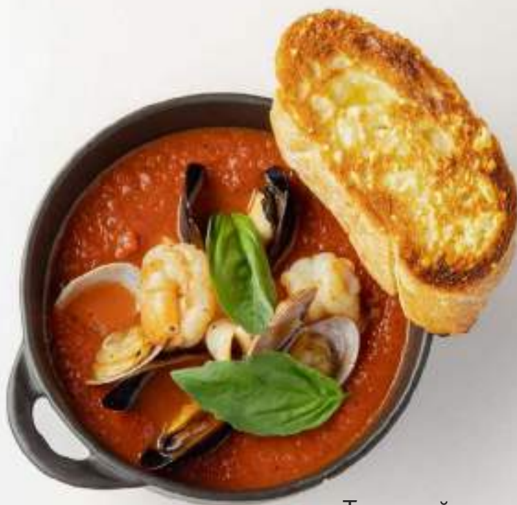
Томатный суп с морепродуктами 990